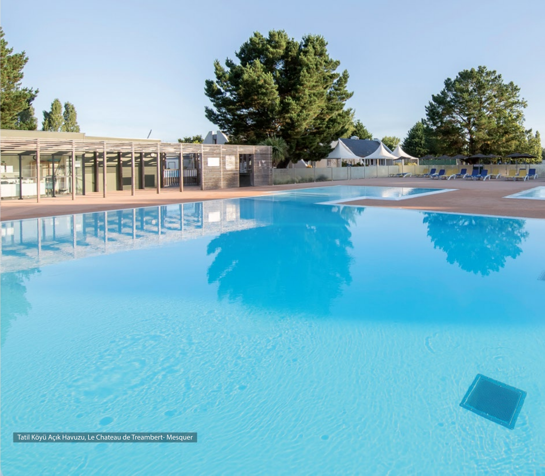
Tatil Köyü Açık Havuzu, Le Chateau de Treambert- Mesquer