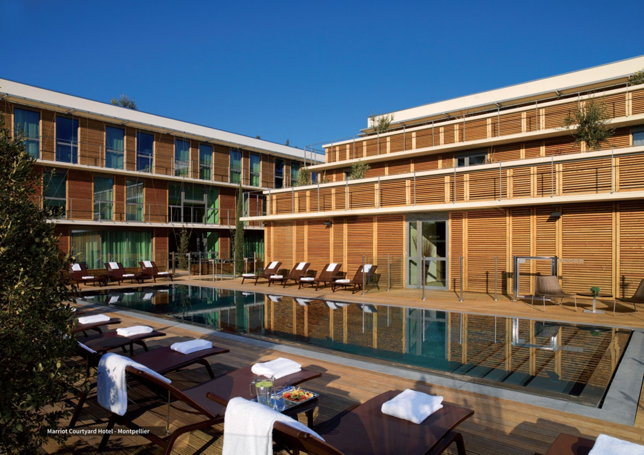
Marriot Courtyard Hotel - Montpellier